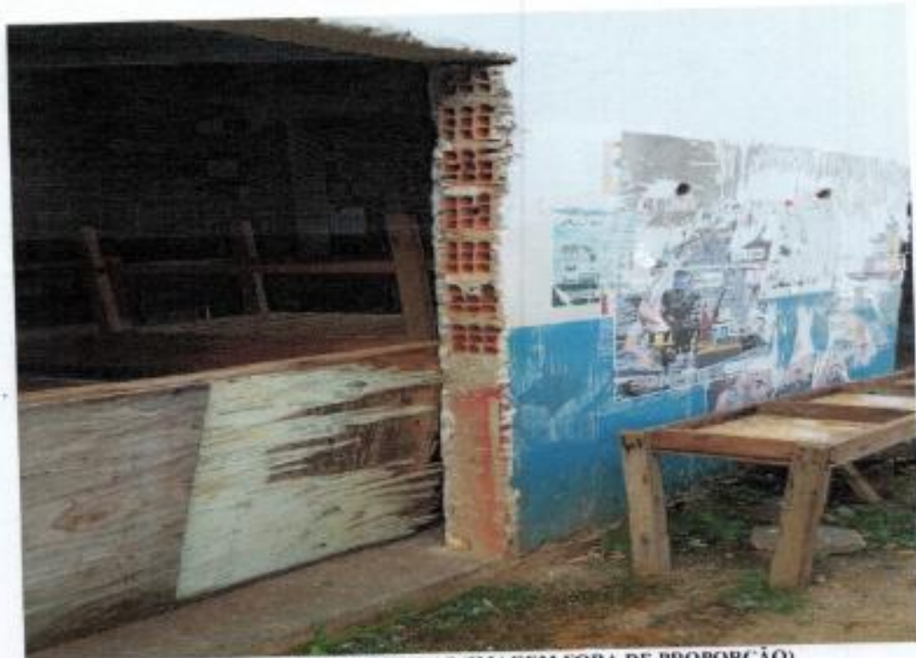
Figura 4-DETALHE ESPALAS (IMAGEM FORA DE PROPORÇÃO)