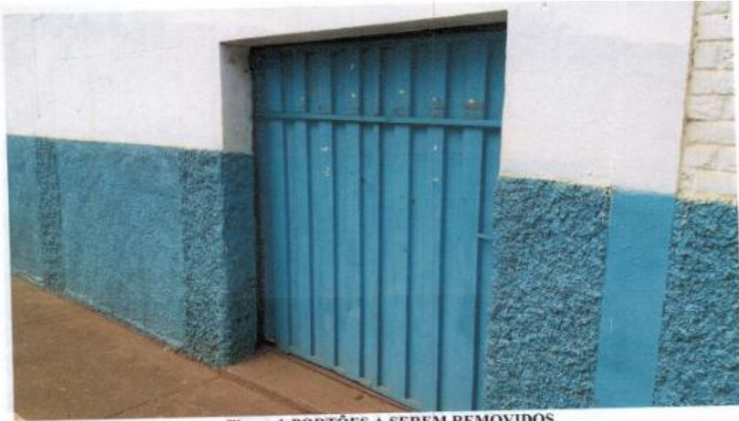
Figura 1-PORTÕES A SEREM REMOVIDOS