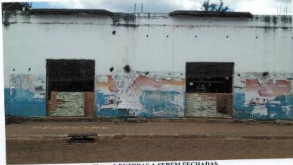
Figura 3-ENTRADAS A SEREM FECHADAS.